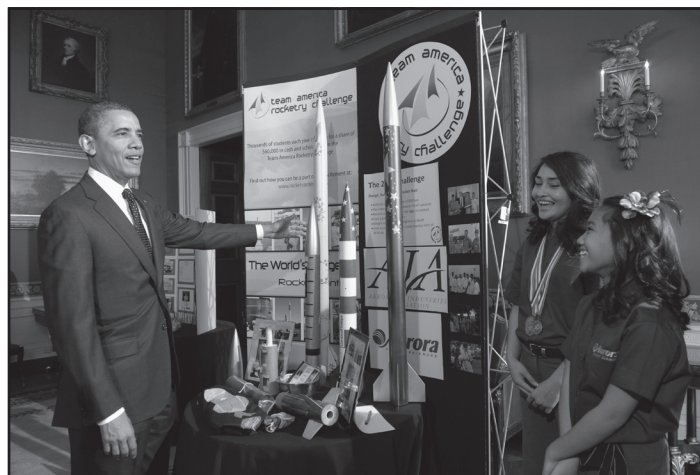
El presidente Obama habla con estudiantes de la maestra Condino.