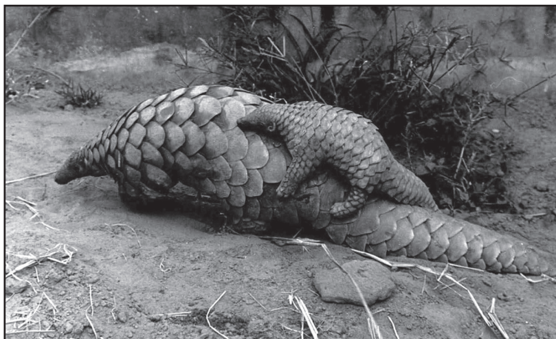
El pangolín cuida su cría casi hasta la edad adulta.